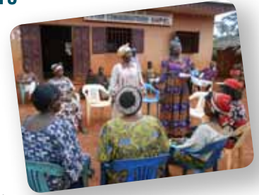
Vidéo : youtu.be/NwTT8atwWAM

Les Forêts Modèles du Cameroun encouragent activement l'organisation et le leadership des femmes rurales. Ces dernières années, plus de 90 micro-projets axés sur le développement des affaires, le marketing et développement de produits ont été financés par l'entremise des Forêts Modèles. Certains produits phares tels que l'huile d'Allanblankia, utilisée dans la fabrication de produits alimentaires et non alimentaires, ont été en mesure d'accéder aux marchés internationaux. La génération de valeur économique et sociale à partir des ressources naturelles a également amélioré leur conservation.