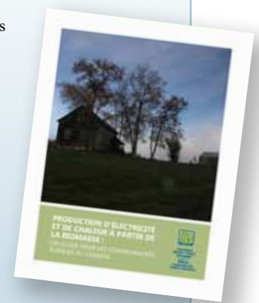
Pour plus d'informations : foretmodele.net

Également, celui-ci a été conçu afin de fournir des informations plus détaillées sur les projets de bioénergie du RCFM, sur les politiques provinciales et fédérales sur la bioénergie et des publications pertinentes sur le sujet. Le guide a été lancé en collaboration avec le site internet wood4energy.ca .