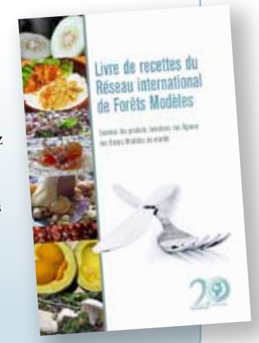
En ligne à : imfn.net/fr/publications-0

Le Secrétariat du RIFM est heureux d'annoncer une nouvelle publication : Livre de recettes du Réseau International de Forêts Modèles - Cuisinez les produits forestiers non ligneux des Forêts Modèles du monde. Le livre met en vedette un mélange éclectique de recettes, y compris des plats principaux, des accompagnements, des desserts et des boissons ... toutes à base de plantes trouvées dans nos Forêts Modèles dans tout le RIFM.