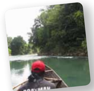
Vidéo : youtu.be/IYJsHCjg89w

En 2006, la Forêt Modèle a aidé les résidents locaux à bâtir une entreprise d'écotourisme axé sur des activités nautiques utilisant des bateaux précédemment impliqués dans l'exploitation illégale des forêts. Les activités de tours en bateaux TORPEDO sur la rivière Ulot gagnent en popularité auprès des touristes locaux et étrangers. Elles fournissent des moyens de subsistance durables pour les résidents ainsi qu'une occasion de faire de la sensibilisation sur les questions environnementales et la protection des forêts.