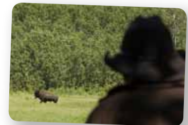
Vidéo : youtu.be/nVW84oQ07DA

Un groupe voué à la conservation des bisons sauvages travaille avec des éleveurs et des agriculteurs et les gouvernements fédéral et provincial afin d'améliorer la conservation d'une population sauvage de bisons des plaines. Avec le soutien de la Forêt Modèle, ils ont identifié des opportunités pour encourager et faciliter les mesures d'intendance par les propriétaires fonciers tout en réduisant les effets négatifs des bisons sur leurs terres.