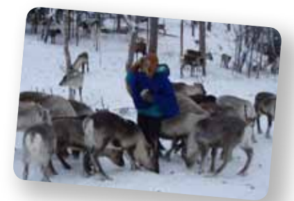
Vidéo : youtu.be/fEtZiNalNiU

Dans la Forêt Modèle de Vilhelmina, Suède, les acteurs locaux et les Autochtones des communautés Sami utilisent un Système d'information géographique participatif (SIG-P) pour réduire les conflits liés à l'utilisation de la terre. L'outil a facilité la compréhension visuelle des couloirs de migration utilisés pour les éleveurs de rennes et les espaces dont se servent les autres utilisateurs des terres. Les acteurs locaux ont ajusté leurs activités pour permettre aux éleveurs de maintenir leurs routes traditionnelles.