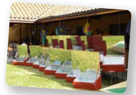
Vidéo : youtu.be/COT1DeFUdnw

La Forêt Modèle de Cachapoal, Chili, encourage l'utilisation de énergie solaire et biogaz comme stratégie visant à améliorer les moyens de subsistance des familles et le développement local. L'initiative contribue à réduire l'utilisation de bois de chauffage et par le fait même les émissions de gaz à effet de serre. Les partenaires de la Forêt Modèle éduquent également le public à la protection et une meilleure gestion de l'environnement.