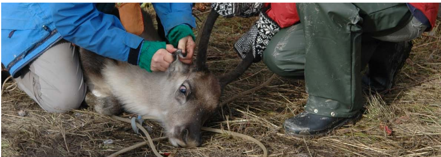
Location: Vilhelmina Model Forest, Sweden