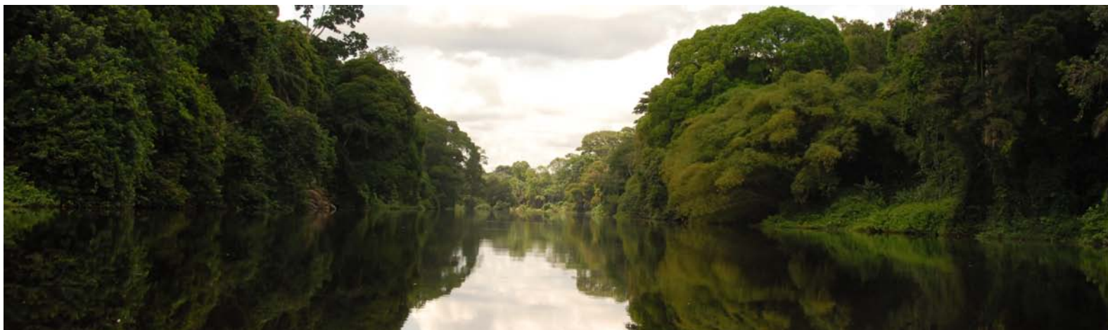
Location: Dja et Mpomo Model Forest, Cameroon

Pour en savoir plus sur la préparation du plan stratégique, reportez-vous Cadre de travail pour la planification stratégique d'une Forêt Modèle .