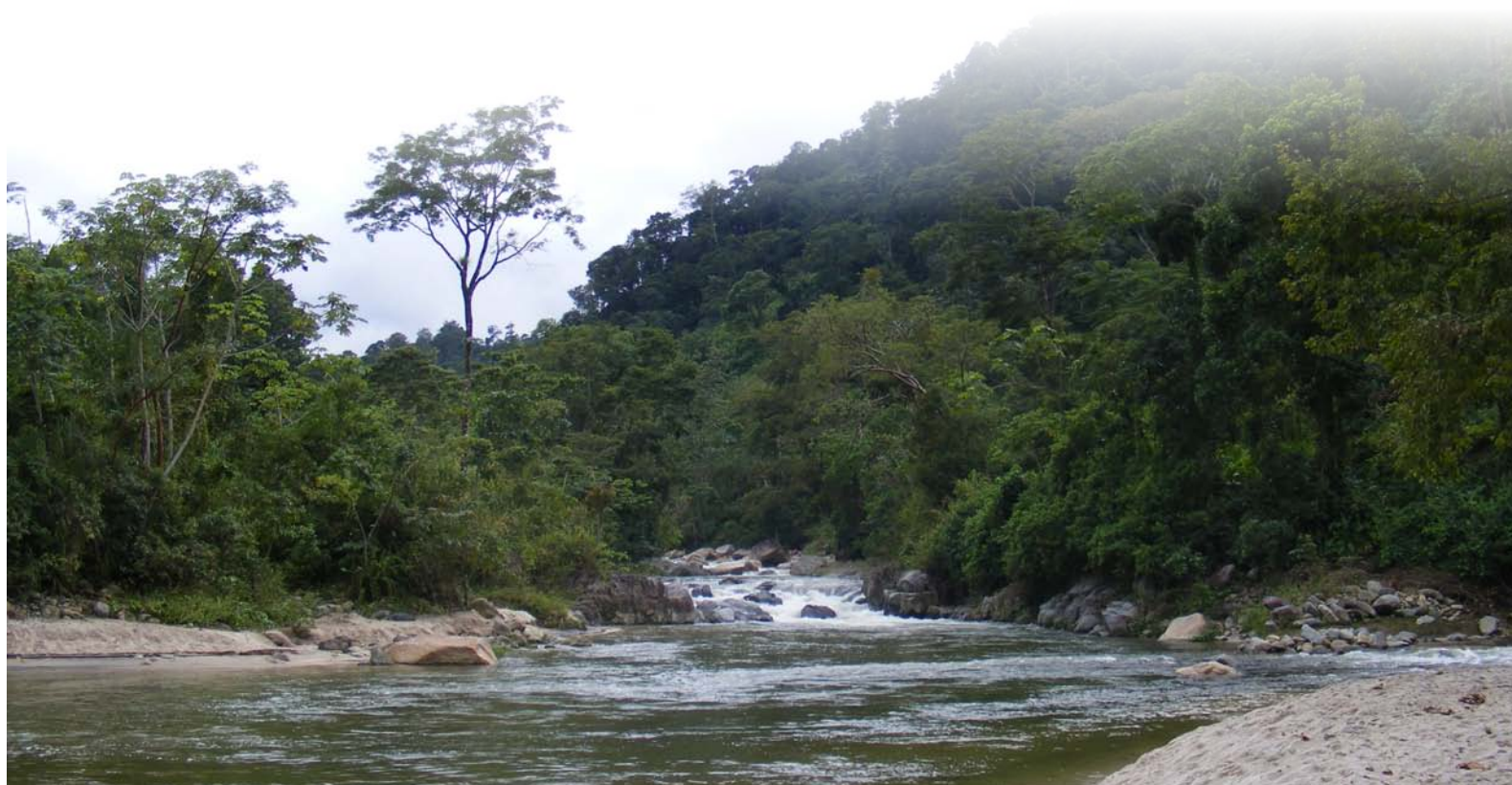
Location: Atlántida Model Forest, Guatemala

Le tableau 2 (ci-dessous) montre certains projets entrepris par des Forêts Modèles. Pour en savoir davantage à ce sujet, veuillez consulter le Cadre de travail pour la planification stratégique d'une Forêt Modèle et le Cadre de travail pour la planification des tâches annuelles d'une Forêt Modèle.