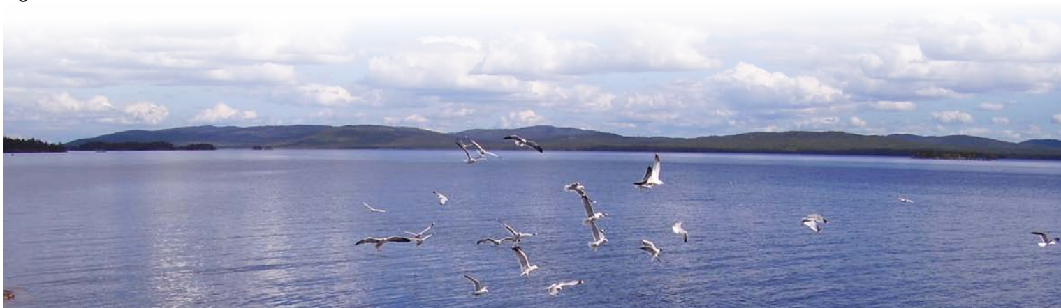
Lieu : Forêt Modèle de Kovdozersky, Russie

Partenaire — Tout membre du grand public — les personnes, les sociétés, les organisations, les gouvernements, les organismes et les associations — qui est disposé à appuyer les objectifs de la Forêt Modèle. Les partenaires comprennent notamment les parties prenantes locales, les organismes donateurs, le Secrétariat du RIFM et les bureaux des réseaux régionaux de Forêts Modèles.