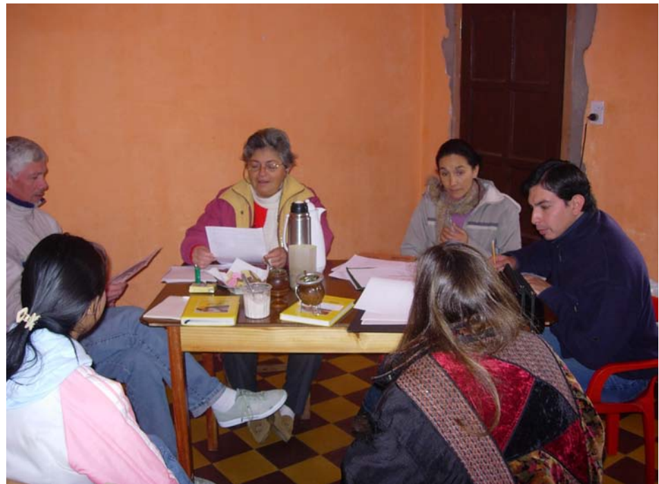
Crédit : Virginia Outon, Forêt Modèle de Jujuy, Lieu : Forêt Modèle de Jujuy, Argentine

Qui plus est, l'exploitation des ressources d'un paysage donné par les parties y étant intéressées facilite le règlement d'un problème complexe et récurrent : la durabilité du projet en soi. Le fait de savoir ce qui arrivera au terme de l'aide officielle au développement constitue toujours une question clé en matière de durabilité. Et lorsque les organismes donateurs évaluent les propositions et les organisations bénéficiaires potentielles, ils examinent souvent le potentiel de durabilité financière à long terme de l'organisation.